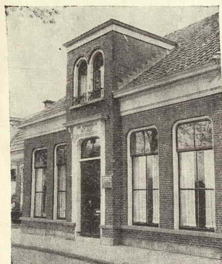
Bankgebouw te Oudebildtzijl

Uw kostbaarheden en waardevolle bescheiden (akten, polissen, waardepapieren, enz.) kunnen veilig opgeborgen worden in onze brand- en inbraakvrije kluis met safe-loketten . Het geeft een rustig gevoel bij afwezigheid!