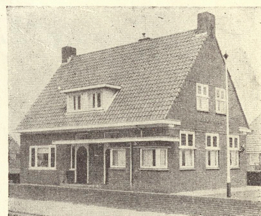
Bankgebouw te St. Jacobiparochie

St. Annaparochie St. Jacobiparochie Nij Altoenae Vrouwenparochie Oudebildtzijl